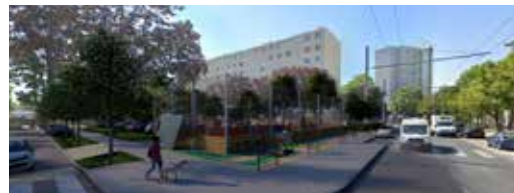
Le nouveau city stade

Le nombre de places de stationnement à l'issue des travaux sera équivalent au nombre de voitures stationnées aujourd'hui.