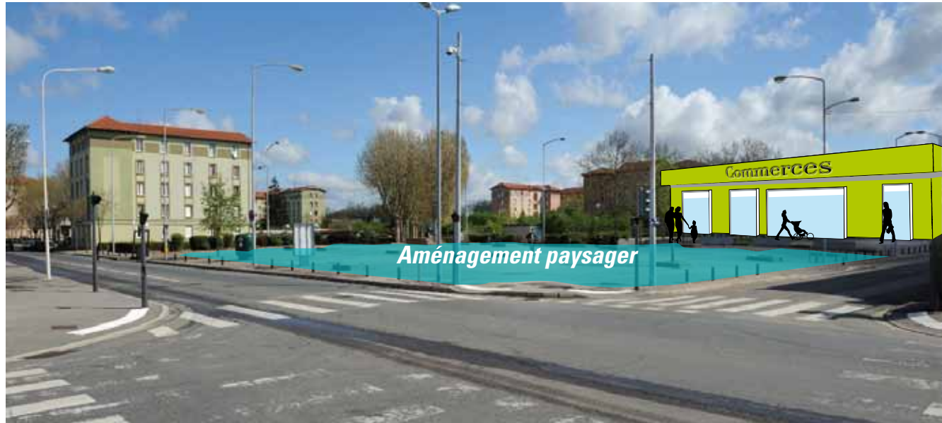
Les futurs commerces se situeront en bordure de la place Ernest Cavellini. Ils prendront place dans un nouveau bâtiment et pourront être livrés en 2014 - 2015.