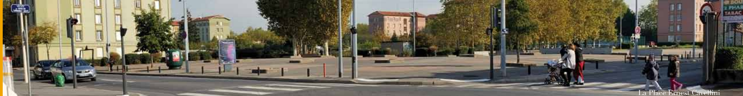
La Place Ernest Cavellini