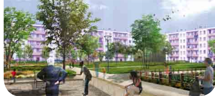
Perspective de l'espace Noëlle Grégoire réaménagé