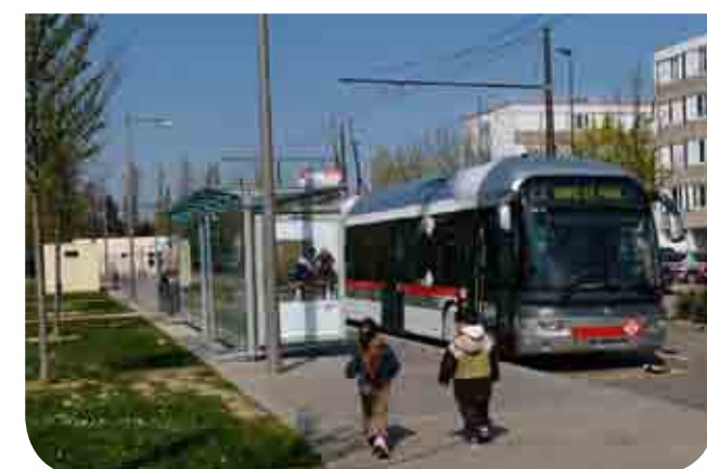
Le trolleybus C3 relie la Grappinière, le centre ville de Vaulx-en-Velin, la gare de la Part Dieu et la Presqu'île de Lyon.

Enfin, de nouvelles rues desserviront les nouveaux logements et d'autres relieront l'avenue du 8 mai 1945. Elles rendront ainsi le quartier traversant et faciliteront l'accès aux différentes résidences.