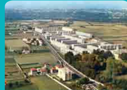
La Grappinière dans les années 60, avant la construction de la ZUP