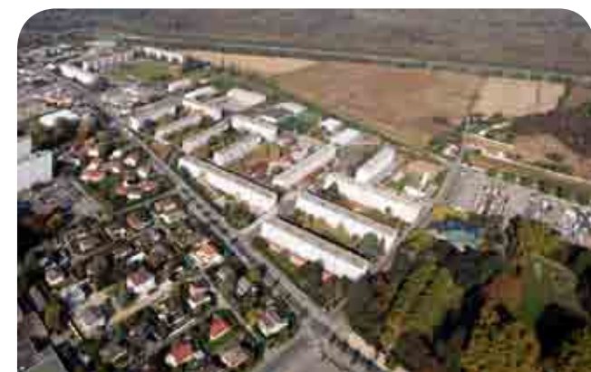
La Grappinière vue du ciel

La démolition du bâtiment des instituteurs qui s'est achevée il y a peu marque le début de la rénovation urbaine du quartier. D'ici quelques années la Grappinière complera de nouveaux logements, de nouvelles rues, de nouveaux commerces... et de nombreux espaces verts et promenades piétonnes qui rappelleront les liens que le quartier entretient avec la nature toute proche, le parc Elsa Triolet, l'ancienne digue, la zone agricole et même, un peu plus loin, le Grand Parc Miribel Jonage et les balnes de Rillieux-la-Pape.