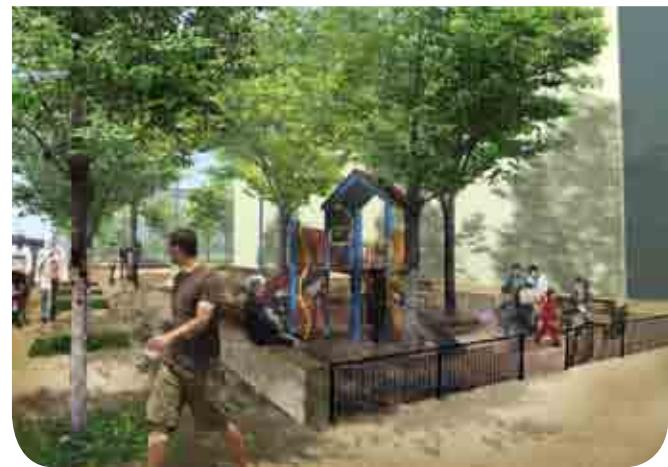
La future place centrale, proche du centre commercial

Une place centrale verra le jour à proximité du centre commercial et l'espace Noëlle Grégoire sera réaménagé. Ils proposeront une série d'activités différentes allant du jardinage à la détente en passant par les jeux ou le sport pour les plus jeunes. Ce projet d'aménagement a été défini lors d'ateliers de coproduction rassemblant habitants et professionnels.