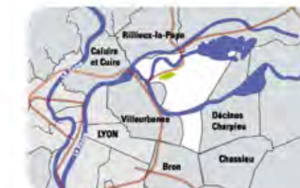
Plan de situation du quartier