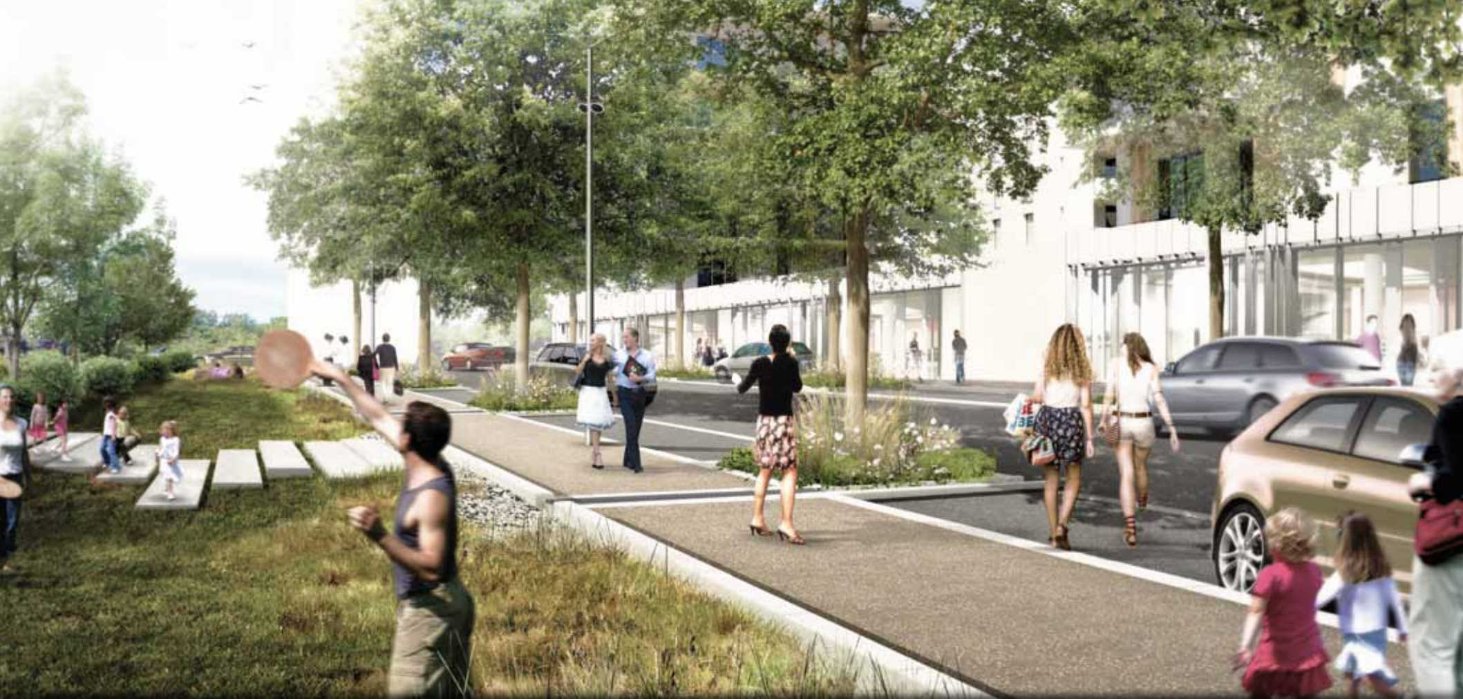
Perspective de la future rue du Pré de l'Herpe. A gauche le jardin de pluie