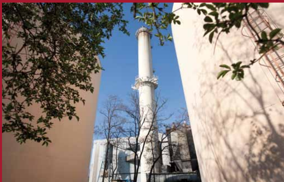
La chaufferie de Vaulx-en-Velin

Gêne occasionnée : circulation perturbée